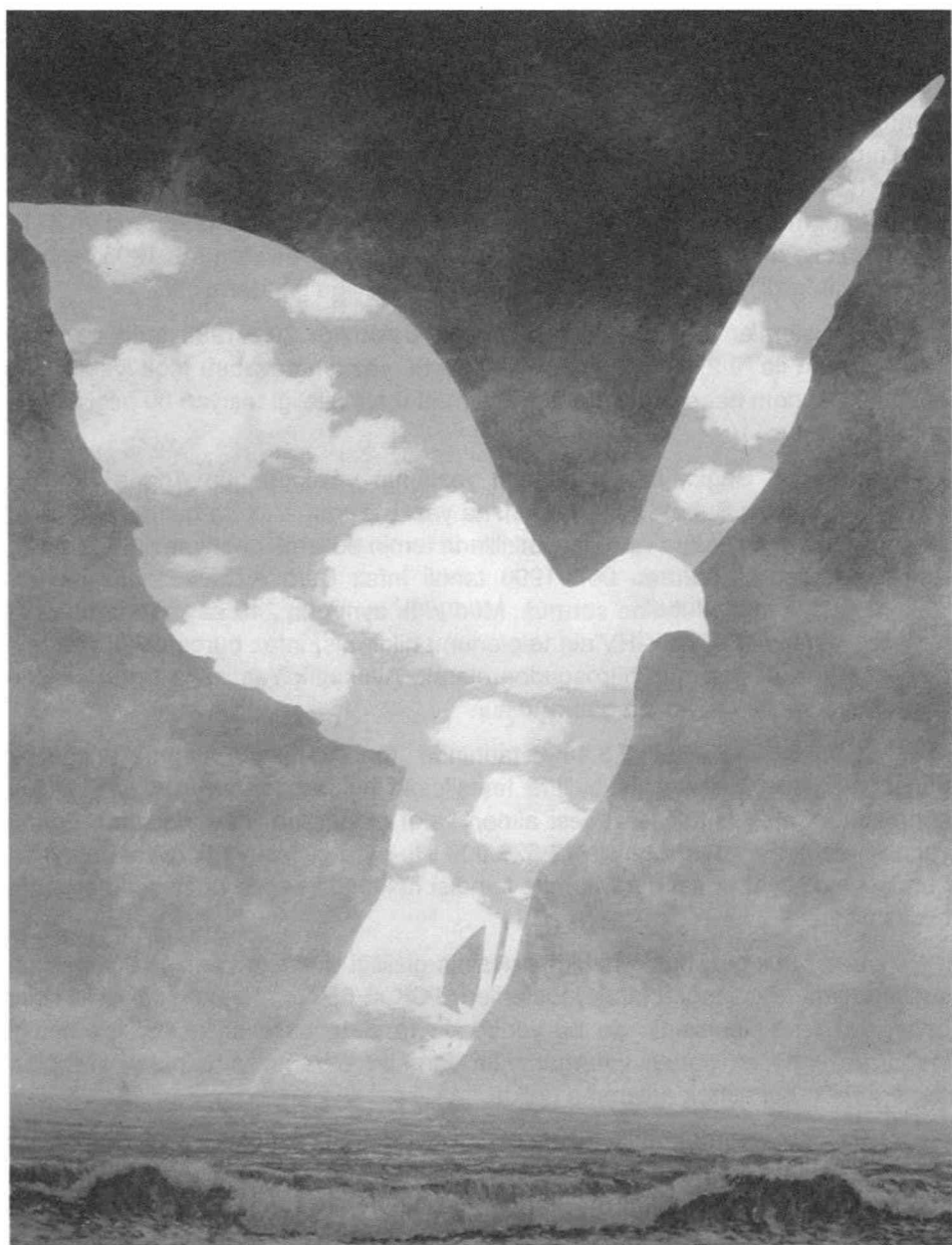
The Big Family, 1963